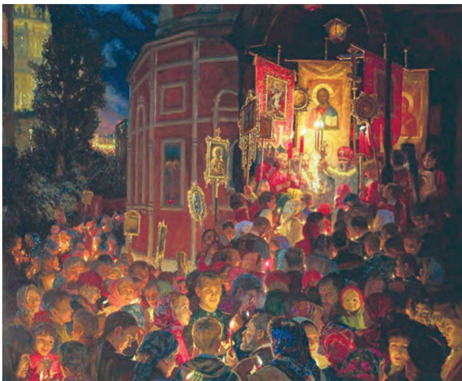
Γιούλια Κουζένκοβα, Πάσχα (2002).