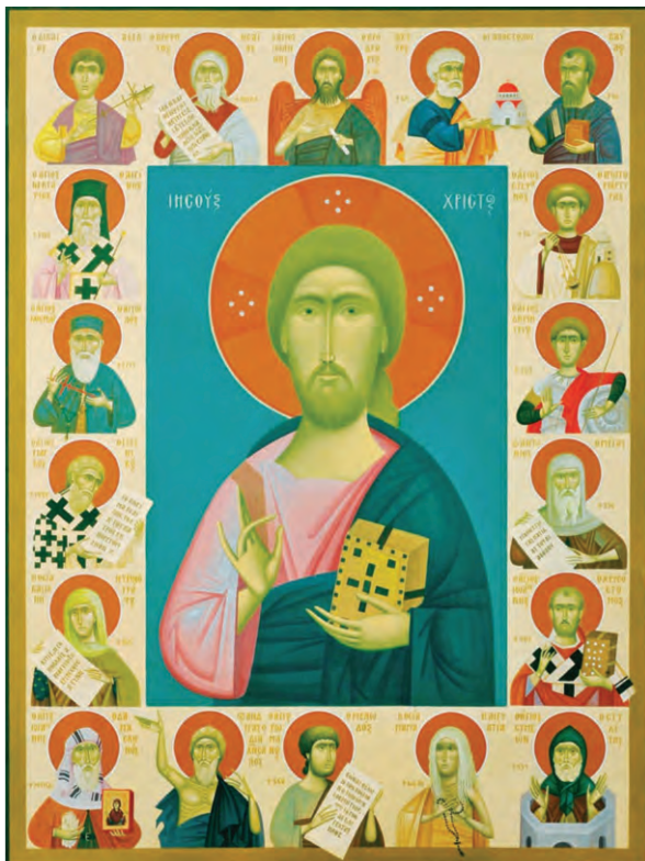
Η Ιστορία της Ορθοδοξίας σε Πρόσωπα. Εικόνα διά χειρός Φίκου, 2012. Αυγοτέμπερα σε χειροποίητο Ιαπωνικό χαρτί κολλημένο σε ξύλο.

Προσοχή! Για να ξεκινήσουμε την τοποθέτησή μας με τη φράση «Επ’ αυτού θα είχα να πω», θα πρέπει να έχουμε ακούσει καλά τις τοποθετήσεις των άλλων.