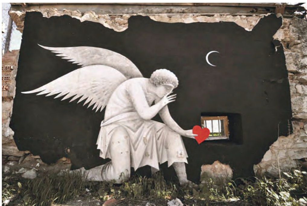
Φίκος, Wasted Love, 2014, graffiti Πειραιάς.

Μποκόρος Χ., Καστέλλα, το δύσκολο καλοκαίρι του 2013, Ιστοσελίδα Χρήστος Θ. Μποκόρος, 17/9/2016.