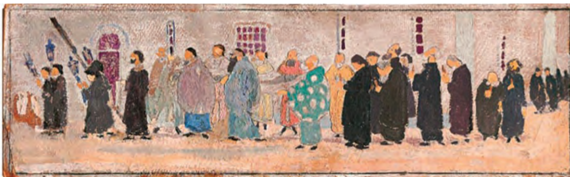
Σπύρος Παπαλουκάς, Λιτανεία, Βημόθυρο, τεύχ. 4, 2010 σ. 125.

Ας μελετήσουμε ποικίλους τρόπους έκφρασης της χριστιανικής πίστης, με τη βοήθεια του παρακάτω κειμένου και των εικόνων, π.χ. στα πανηγύρια, στη λαϊκή τέχνη, στη μικροτεχνία, στην κεντητική, κειμήλια που βρίσκονται σε μονές, σε ποιήματα, σε έργα τέχνης.