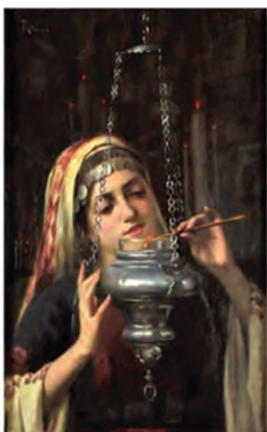
Θεόδωρος Ράλλης (1852-1909) Η Κανδήλα.