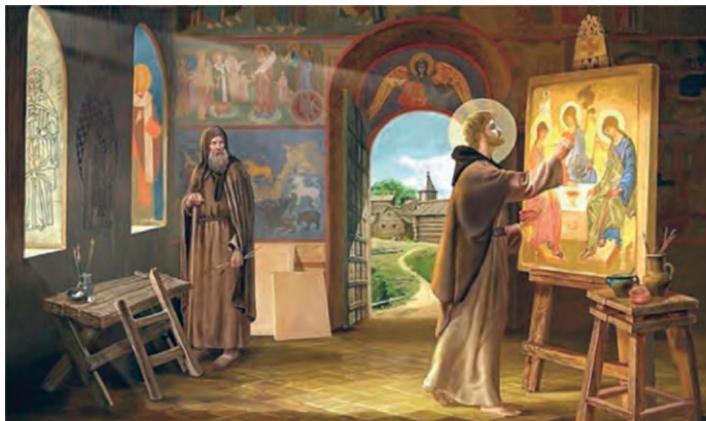
Ο Αντρέι Ρουμπλιόφ, περίφημος Ρώσος ζωγράφος και αγιογράφος (1360-1438), ιστορεί την εικόνα της Αγίας Τριάδας. [Σύγχρονος πίνακας]