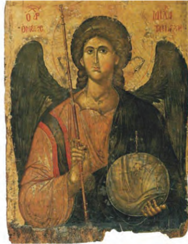
Αριστερά: Μιχαήλ Άγγελος, Άγγελος με κηροπήγιο, 1494. Βασιλική San Domenico, Bologna, Ιταλία. Δεξιά: Ο Αρχάγγελος Μιχαήλ, φορητή εικόνα, 14ος αι., Βυζαντινό και Χριστιανικό Μουσείο Αθηνών.